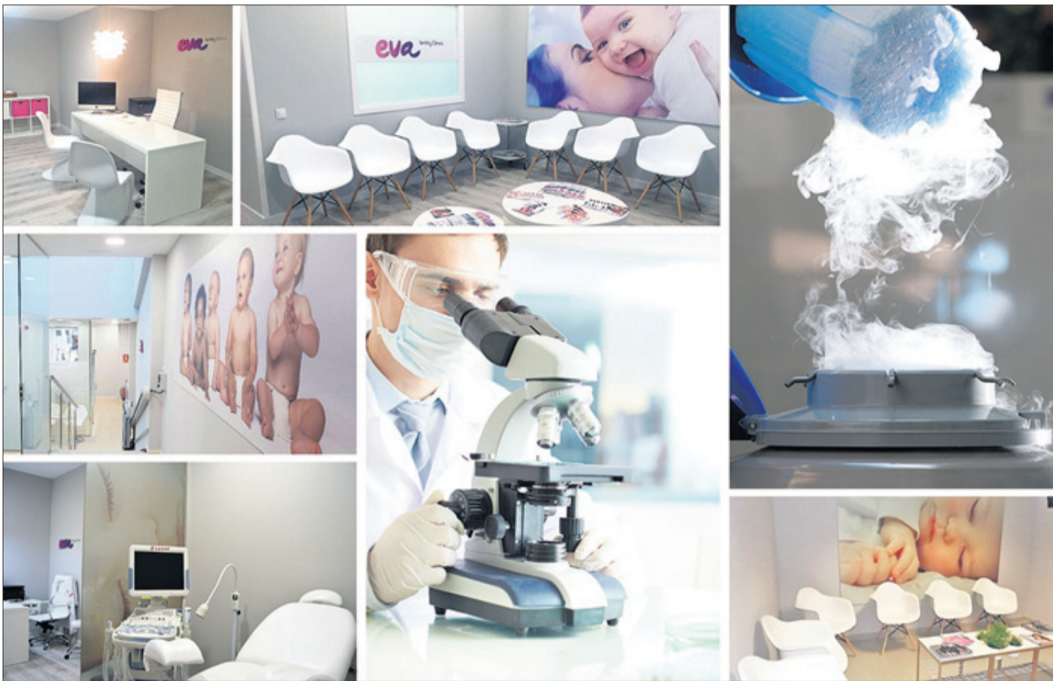
Clínicas EVA, con un total de 43 clínicas en España, se caracteriza por su competitividad en cuanto a precios sin renunciar a la máxima calidad.